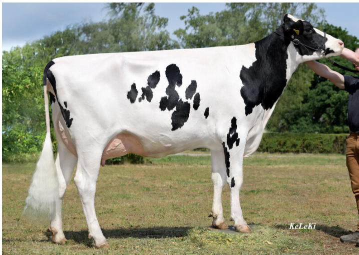
DED Chalina, Agrarprodukte Dedelow GmbH