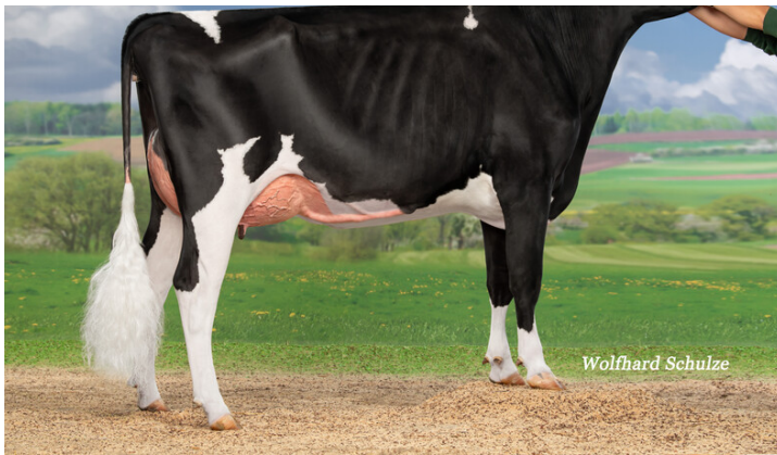
Diadem, 1, Agrarhof Busse-Paucke GbR sperma_mutterfotos