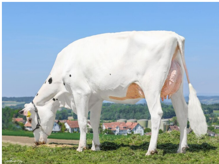
MM: OH Diamond