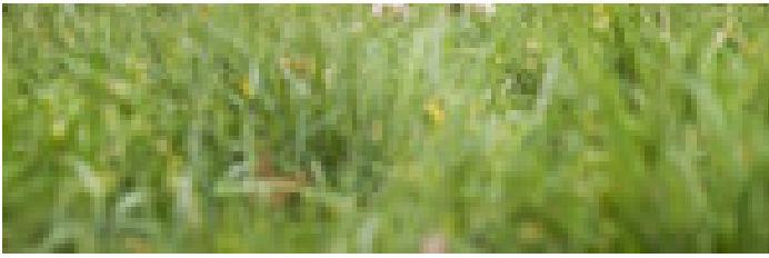
M: WIL Daffy