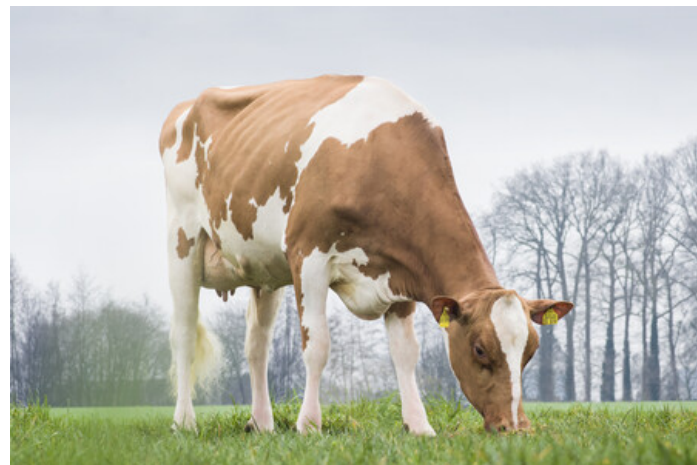
M: WIL Daffy