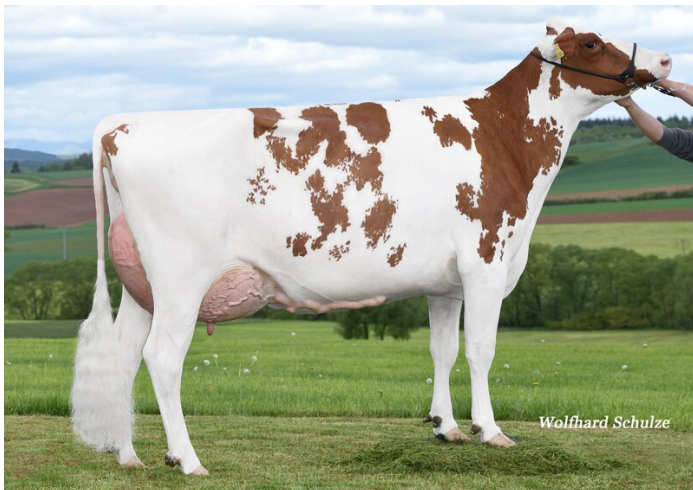
MMM: Rosina Pp* VG-89